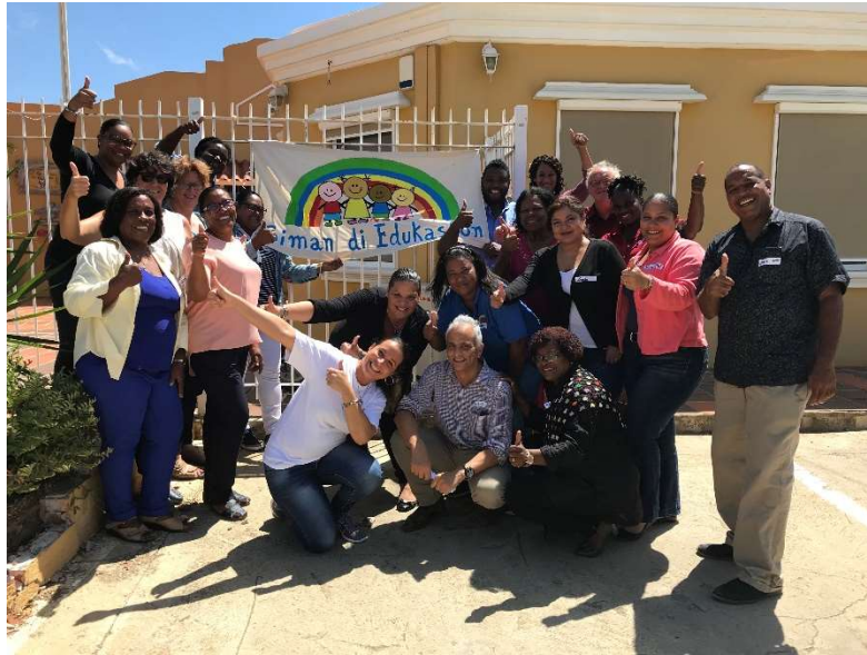
Herstelgericht werken op het centrum voor Jeugd en Gezin op Bonaire

Ik voelde me op de eilanden veilig en gesteund; werd er uitgedaagd taken op te pakken en werd daarin gesteund door anderen. Mijn bijdragen werden gewaardeerd wat mij dat prachtige gevoel gaf dat ik ertoe deed. Er werd voldaan aan een van de meest diepe behoeften van ieder mens: het gevoel betekenis te hebben. Kenmerkend was ook het kleine verschil tussen mijn buitenwereld, dat wat ik aan anderen liet zien, en mijn binnenwereld, dat wat er zich bij mij van binnen afspeelde. Hoe onveiliger mensen zich voelen, hoe groter dat het verschil wordt: je kijkt wel uit je werkelijke 'ik' te laten zien. Ik hechtte me aan de mensen die ik op de secure base ontmoette en het onvermijdelijke gevoel was een zeker gevoel van verdriet bij het afscheid.